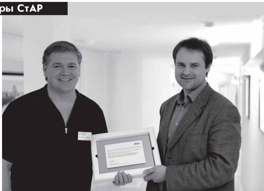
Вручение сертификата «Центр клинического мастерства Nobel Biocare»

Цель любого стоматологического лечения, независимо – одного зуба или тотальной реконструкции – создание стабильного эффективного функционального результата и достижения