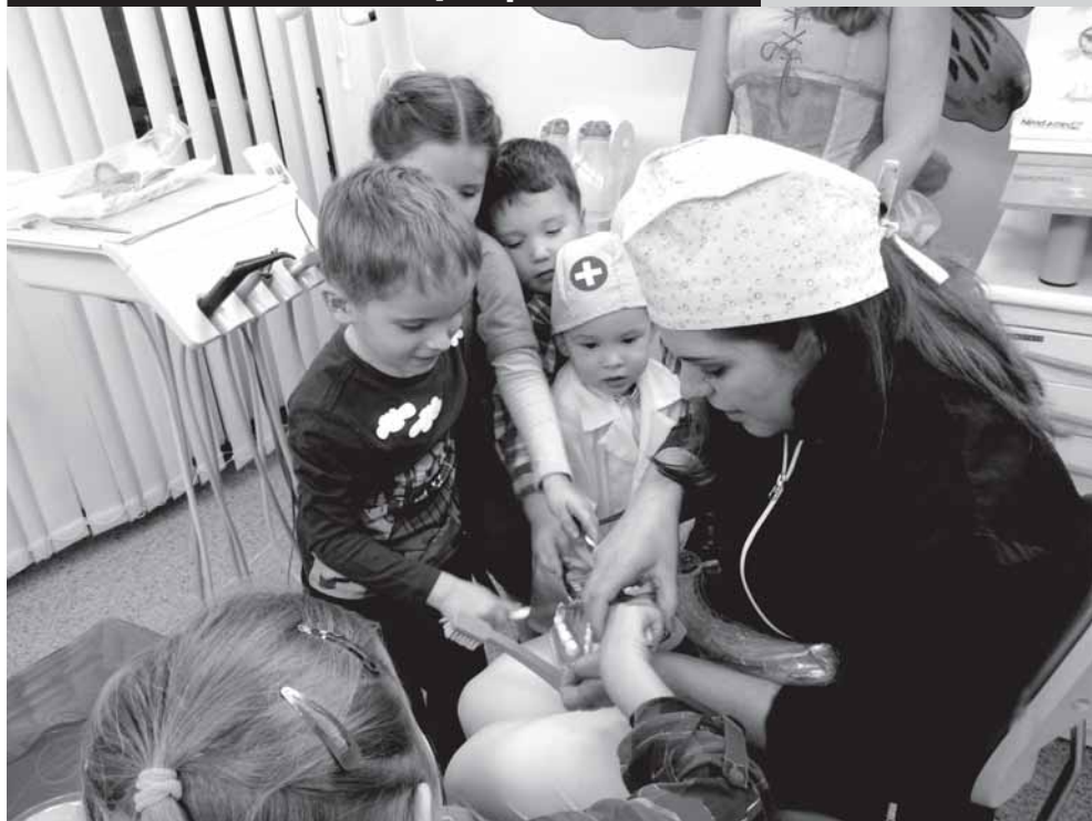
Праздник для детей «В гостях у Зубной Феи»