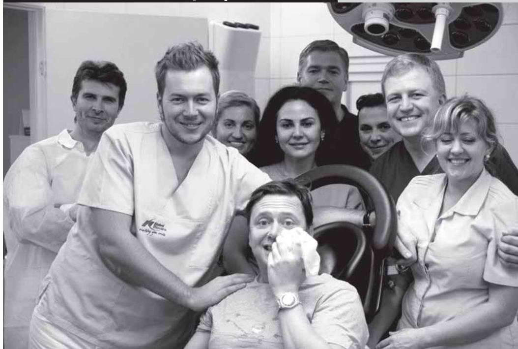
Команда профессионалов и счастливый пациент после удачно проведенной операции

ЦМСИН проводятся практические курсы для ознакомления врачей с клиническими проявлениями и диагностикой гипертонуса жевательных мышц в стоматологической, неврологической и эстетической практике. Используя более чем 10-летний опыт практического применения ботулинического токсина типа А (БТА) в клинической практике, демонстрируются многочисленные аспекты взаимодействия между специалистами разных дисциплин в рамках решения задач комплексной реабилитации пациентов со сложными функциональными и эстетическими отклонениями: мышечно-суставной дисфункцией, миофасциальным болевым синдромом лица, бруксизмом, оро-мандибулярной дистонией, лицевыми болями и др. Наглядно демонстрируется, как осуществляется осмотр пациентов с различными формами гипертонуса жевательных мышц и как выполняются процедуры лечения с помощью инъекций БТА с применением ЭМГ-контроля. По данной теме сотрудниками ЦМСИН написано и опубликовано более 50 научных работ.