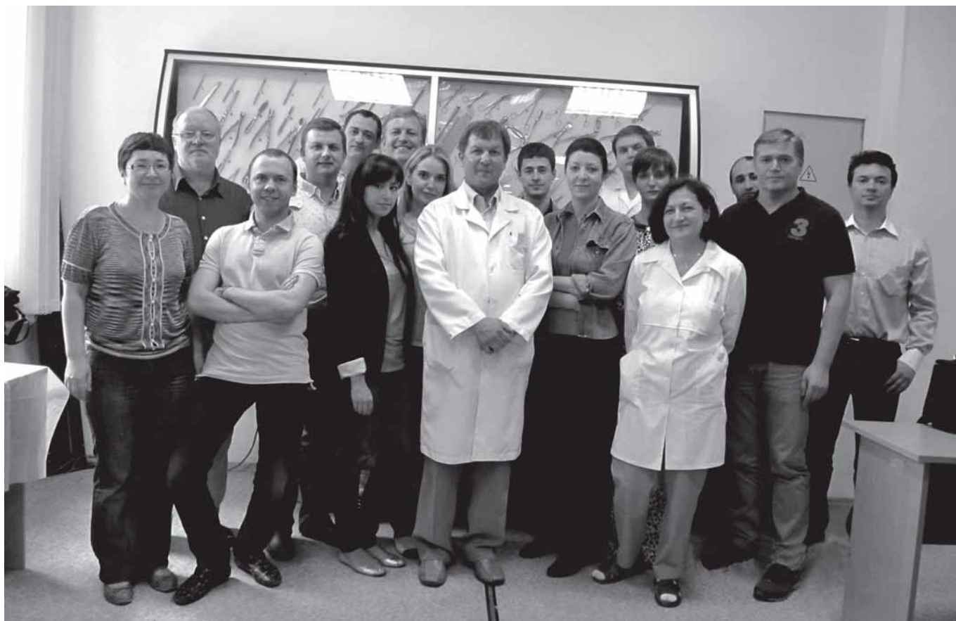
Практический семинар: «Макро-микроанатомия ВНЧС и жевательные мышцы» г. Санкт-Петербург

14 июня 2013 г. на базе кафедры хирургии оперативной и клинической анатомии Санкт-Петербургского государственного медицинского университета им. акад. И. П. Павлова нами был организован теоретический и практический семинар на тему: «Макро-микроанатомия ВНЧС и жевательные мышцы». В курсе приняли участие стоматологи-терапевты, хирурги, ортодонтологи, ортопеды, неврологи. Участникам была предоставлена уникальная возможность анатомического вскрытия, что позволило иметь доступ ко всем структурам височно-нижнечелюстного сустава, суставной и жевательной мускулатур, иннервации и кровоснабжению данного региона. Это позволило практикующим врачам-стоматологам лучше понять сложность организации кранио-мандибулярной системы. В ходе дискуссий были разобраны многие актуальные вопросы, с которыми врачи-стоматологи сталкиваются в своей ежедневной практике.