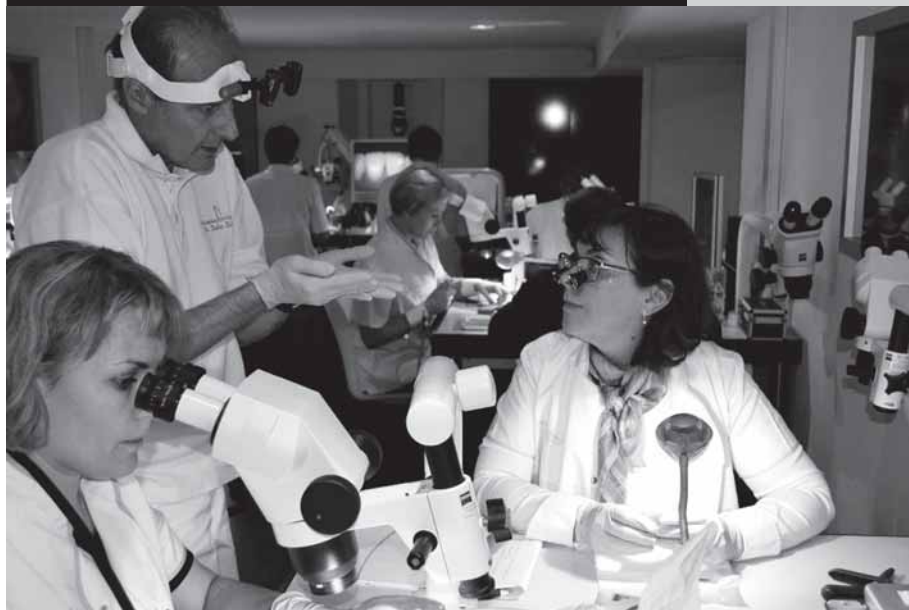
Обучение наших докторов в The Geneva Smile Center

мы смогли отладить механизм работы, что в конечном итоге удалось во многом благодаря слаженным действиям коллектива, которым мы очень гордимся. Раньше наше медицинское учреждение работало в рамках традиционных технологий, но уже три года успешно внедряется новая концепция. Пришлось всё кардинально поменять, но это того стоило. В своей работе Коллектив Центра постоянно вводит в практику и развивает многие новые передовые направления, технологии. Это относится и к Стоматологии, и к Стоматоневрологии, и к косметической стоматологии. Иногда бывает очень сложно, но это и есть наша миссия – получаешь моральное удовлетворение, когда решаешь разного рода профессиональные головоломки во благо здоровья человека. Зуб является только одним из элементов зубочелюстной системы, но сама система является подсистемой или структурным компонентом всего организма в целом. Мы используем новейшую диагностическую аппаратуру, широко применяем электромиографию, шинотерапию, ботулинотерапию. Наш проект — это квинтэссенция самых прогрессивных знаний и умений, основанных на глубоком понимании биологической природы человека и охватывающих весь период нашего развития как вида, что и дает нам возможность понимать индивидуальные особенности каждого человека и применять законы и